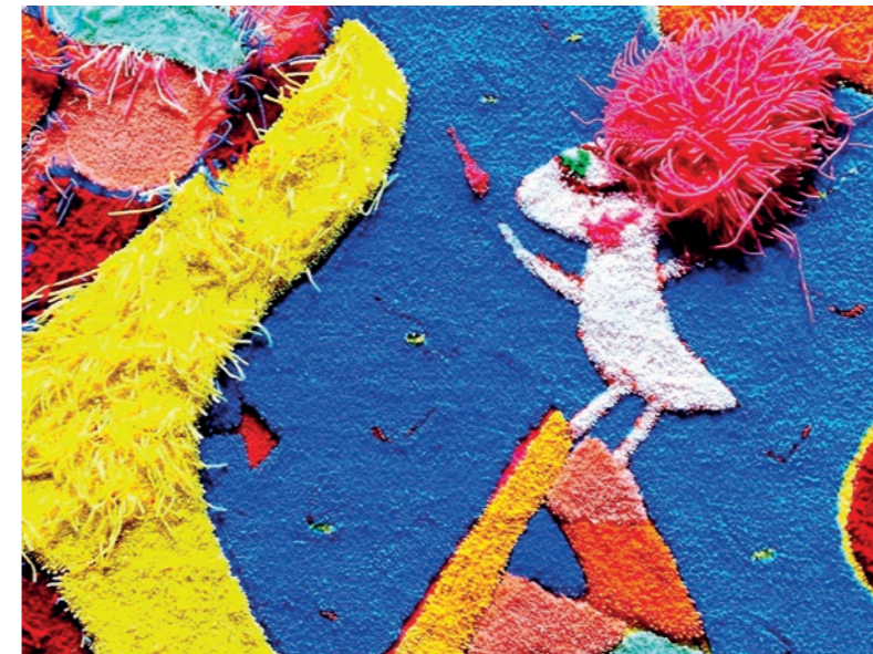
La SACLA, More is more! 2020